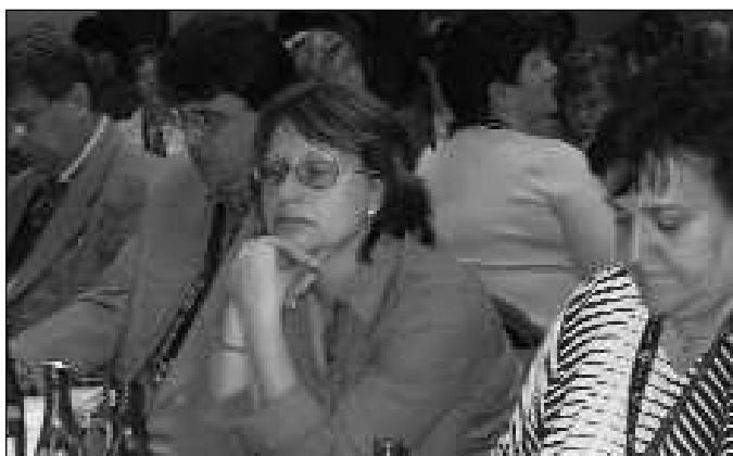
Delegátky kolegyně z České pošty – Praha a Střední Čechy

Závěrečné slovo sjezdu patřilo novému zvolenému předsedovi. Poděkoval funkcionářům OS ZPTNS za práci v předchozím období, připomněl své dosavadní vykonávání funkcí v odborech. Za velký problém, na který zatím není nalezen recept, označil pokles členské základny, malý zájem mladých lidí o odbory i absence hrdosti na odborovou přís-