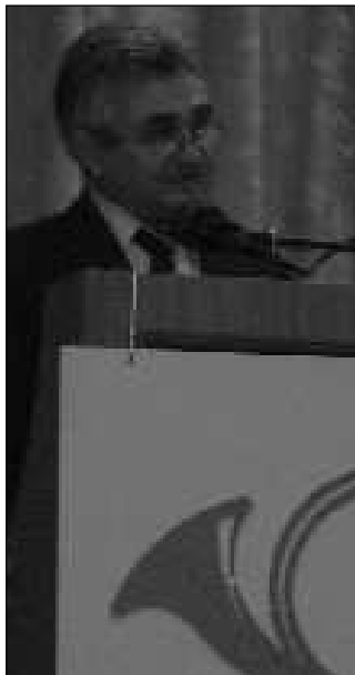
Předseda ČMKOS Milan Štěch při vystoupení na IV. sjezdu OS ZPTNS.