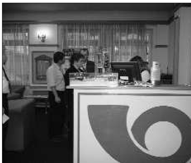
Česká pošta Liberec otevřela u příležitosti IV. sjezdu Odborového sjezdu zaměstnanců poštovních, telekomunikačních a novinových služeb přepážku v libereckém hotelu Babylon, kde si zájemci mohli nechat orazít pohledy či dopisnice příležitostným razítkem, které jim bude připomínat účast na konání sjezdu.