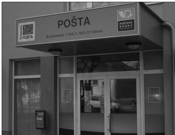
Nová pošta v Senci.

Další informace na webu OS ZPTNS a u funkcionářů základních organizací.