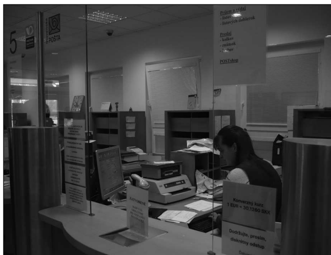
Přepážka bez neprůstředných skel.